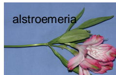
Alstroemeria allergi (blomsterhandler)